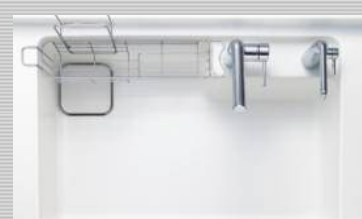
すべり台シンク(人工大理石)/ホワイト