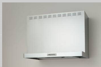
平型シロッコファンフード(フード色前幕板):シルバー