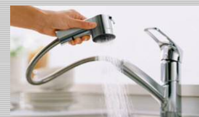
マイクロソフトシャワー水栓(ハンドシャワー・エコシングル)