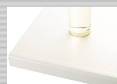
人工大理石カウンター/UH:ライトストーン・ホワイト