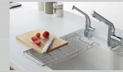
シンクパレット(すべり台シンク用)