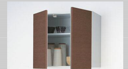
ミドルウォールキャビネット